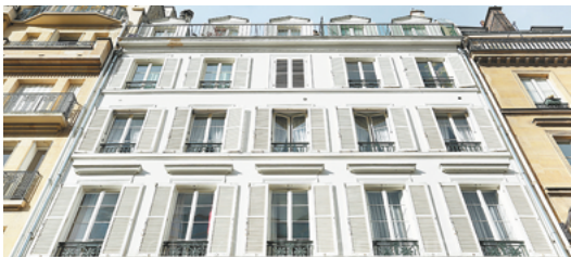
Rue Madame, Paris 6°