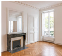
Rue Madame, Paris 6°