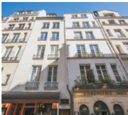
Rue Saint-Louis en l'Île, Paris 4°