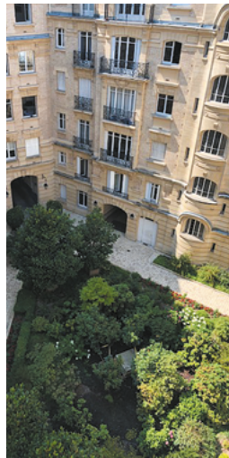
Rue de la Pompe, Paris 16°

Photographies concernant des investissements déjà réalisés, à titre d'exemple, mais ne constituant aucun engagement quant aux futures acquisitions de la SCPI.